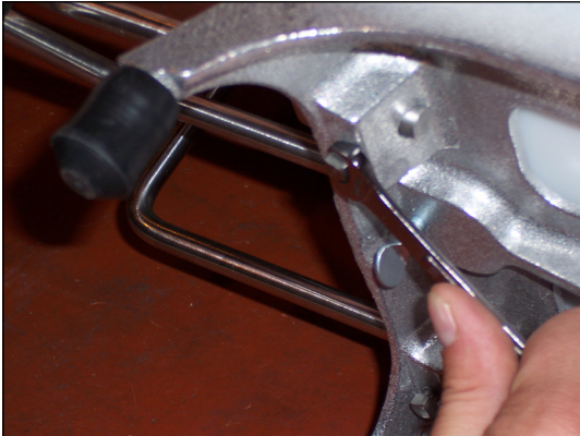
Figure 3. Ajustement de la tête de poussée à travers les lames