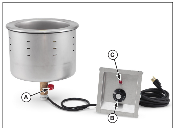
Figura 1. Características y controles.