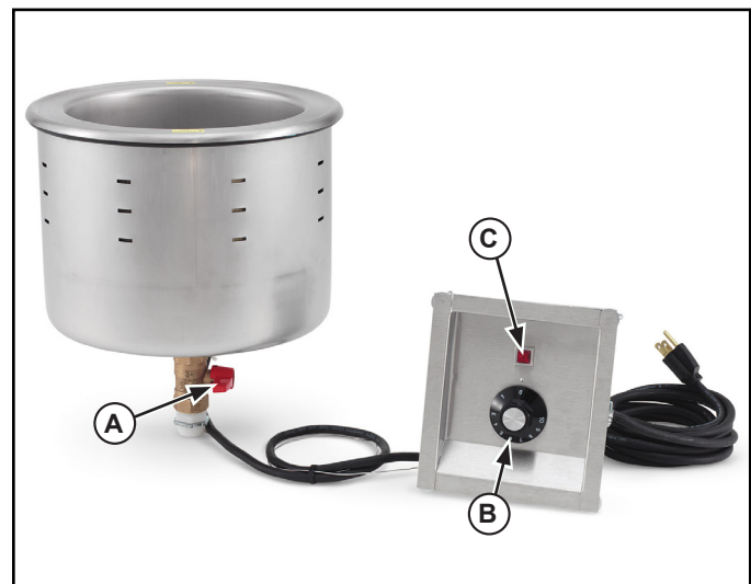
Figure 1. Features and Controls.